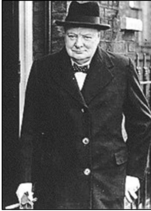
ونستون چرچل أيام الحرب

في الحديث الذي جرى بين (يودل) وبين الجنرال فون شتوليناغل الذي كان يشغل منصب "مدير التسليح والميرة الأول Oberquartiermeister 1" في قيادة الجيش العليا، أحد المشاركين في مؤامرة (هالدر) طلب تأكيدات خطية من (ق.ع.ق.م) بأن تحاط قيادة الجيش العليا علماً بأمر هتلر بالهجوم قبل وقوعه بخمسة أيام. فأجاب يودل أن تقلبات الطقس لاتدع مجالاً لأكثر من يومين وعلى كلِّ كانت المهلة كافية للمؤثرين. إلا أنهم كانوا بحاجة الى تأكيدات من نوع آخر- هل هم مصيبون في إفتراضهم بأن بريطانيا وفرنسا ستدخلان الحرب ضد ألمانيا إن نفذ هتلر عزمه في غزو چيكوسلوفاكيا. ولهذا السبب قرروا إرسال وكلاء يوثق بهم الى لندن ليكشفوا عما إنتوته بريطانيا،