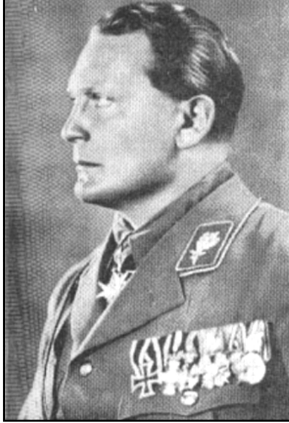
مارشال الرايخ غورنك

في اذنه شيئاً حتى صرخ هتلر "قف! لا كلام إلاً بأذني!" لم يصل بكلامه الى نتيجة ولم يوافق واحد من الثلاثي القبايض على مقاليد الحكم في دولة بافاريا على التعاون معه حتى بتهديد المسدس، وبدا الإنقلاب لايسير وفق الخطة المرسومة ثم اندفع هتلر الى القاعة كأنه يطيع حافزاً مفاجئاً وصعد المنصة مواجهاً الحاضرين معلناً أن أعضاء الحكومة الثلاثي في الغرفة المجاورة قد انضموا اليه لتشكيل حكومة قومية جديدة. وصرخ "ان الوزارة البافارية قد نُحيت... وأعلن إسقاط حكومة مجرمي تشرين وعزل رئيس جمهورية الرايخ. وستعلن اسماء أعضاء حكومة قومية جديدة في مونخ قبل نهاية اليوم. سيشكل جيش ألماني قومي فوراً... وأنا اقترح تصفية الحساب النهائي مع مجرمي تشرين وان تكون الإدارة السياسية في الحكومة القومية بيدي وسيتولى (لودندورف) قيادة الجيش القومي الألماني... ان مهمة